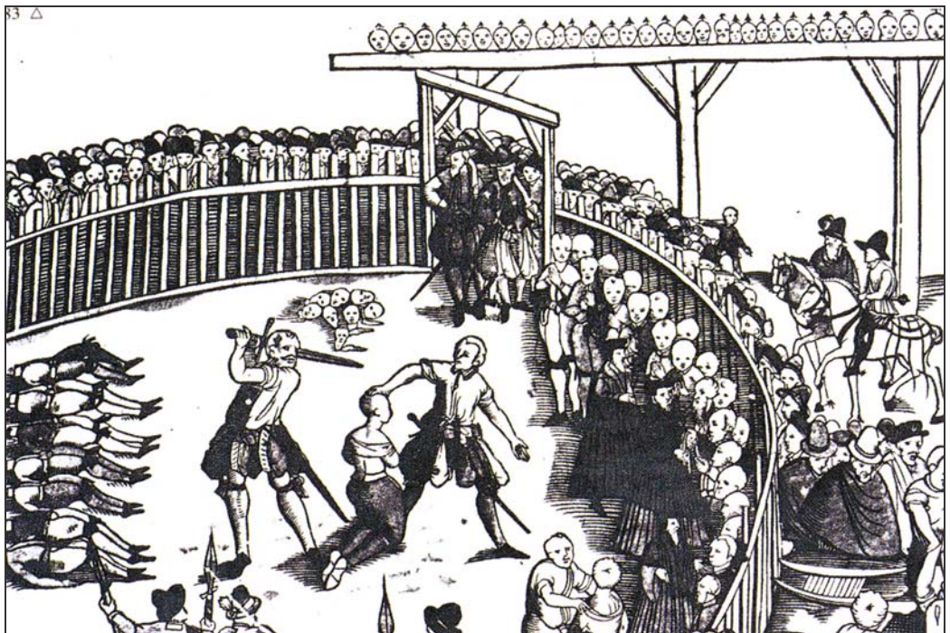
Nok var sørøverne ofte støttet af visse magthavere, men hvis de blev fanget af fjenden, var straffen hård. Her bliver en flok sørøvere halshugget, og deres hoveder sat på stager.

Straffen for sørøveri var hård. I middelalderen blev sørøverne halshuggede og fik deres hoveder sat på pæle til skræk og advarsel. I renæssancen hører vi om et større antal sørøvere, der blev lagt på hjul og stejle. Sørøveriet var også et barsk erhverv. Ofte blev der gjort kort proces med søfolkene fra de erobrede skibe; de blev simpelthen kastet i havet.